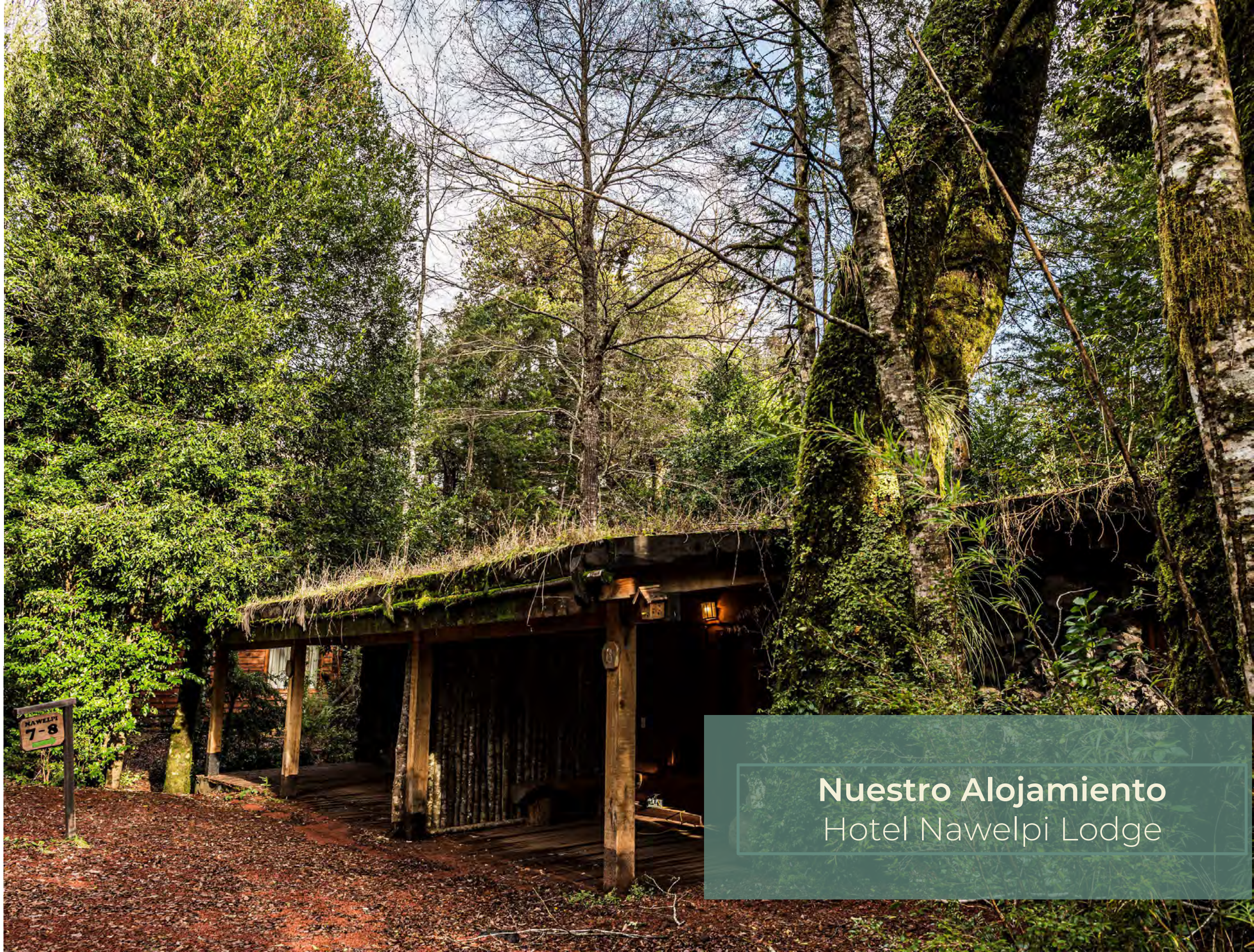
Nuestro Alojamiento Hotel Nawelipi Lodge