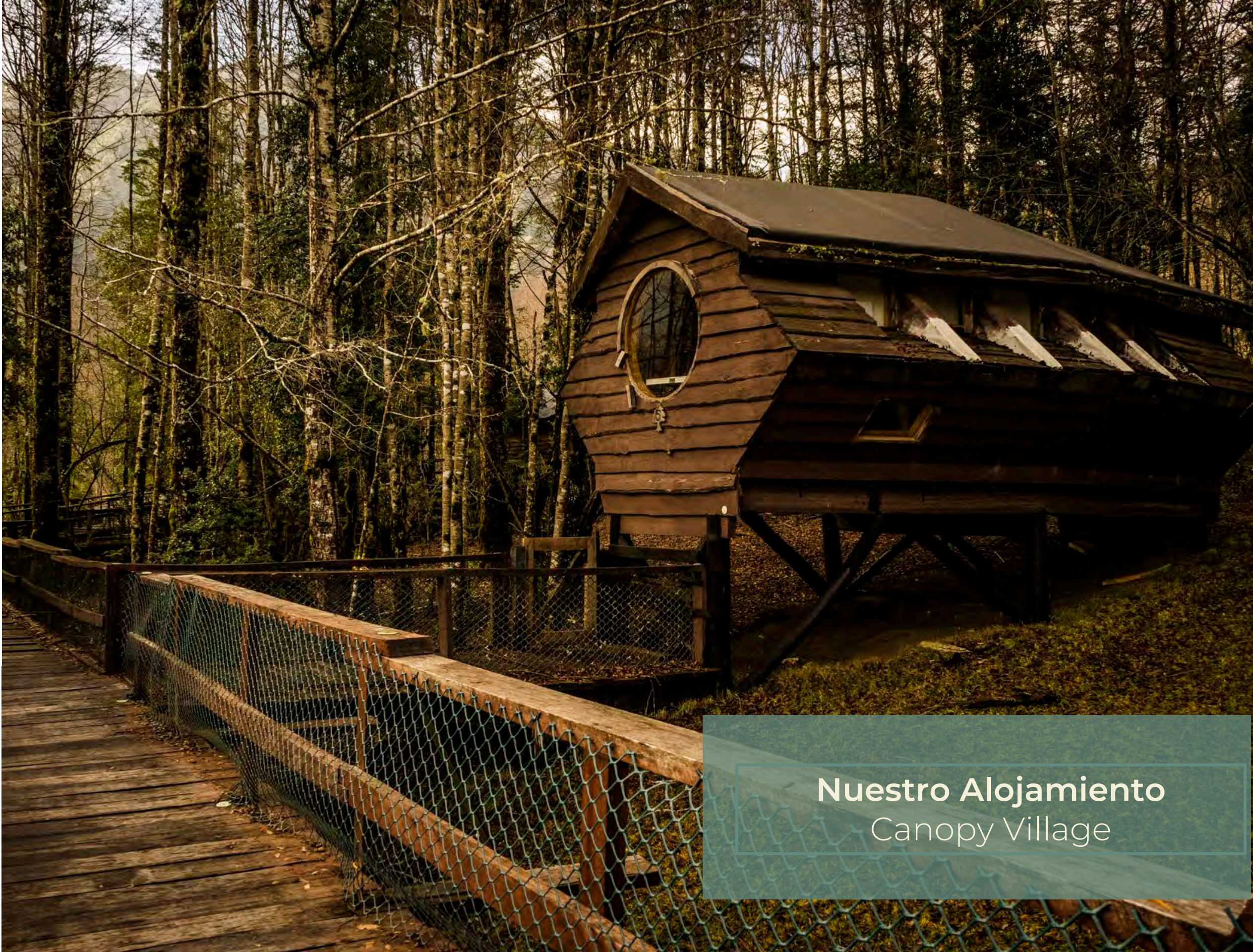
Nuestro Alojamiento Canopy Village